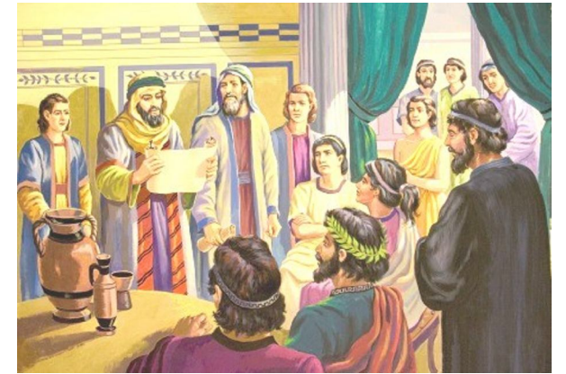
Mensaje: “La vida de los primeros cristianos”