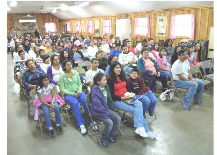
Foto del Campamento Familiar WAMAVA 2010