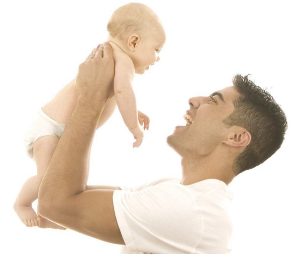
Mensaje: “El papá hace la diferencia”